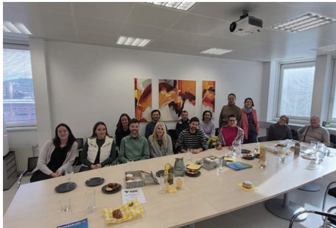
Die Delegierten der ÖLI-UG Tirol bei der Fraktionssitzung

Abläufen. Unstrittig war auch ein zentrales Anliegen der ÖLI-UG nach klimafitten Klassenzimmern , um mit Hitzeschutz, Belüftung, nachhaltiger Baulichkeit und Energieversorgung die Unterrichtsqualität in Zeiten des Klimawandels zu sichern. Der Vorstoß der